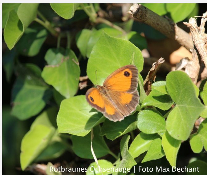
Rotbraunes Ochsenauge | Foto Max Dechant