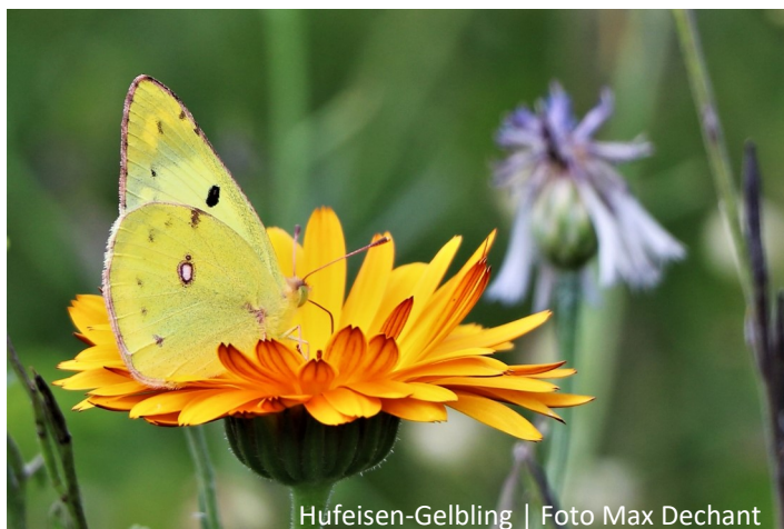
Hufeisen-Gelbling | Foto Max Dechant